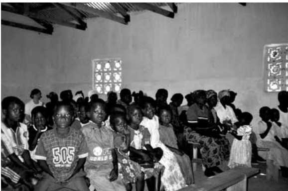
Gottesdienst in Mukubu

tesdienstes verdoppelt sich aber die Teilnehmerzahl durch weitere Hinzukommende auf 70, ein Drittel davon sind Kinder. Die Gemeinde sitzt auf drei Reihen aus einfachen Holzbänken ohne Lehne: in der Mitte die Kinder, links die Frau-